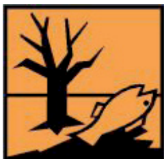
PELIGROSO PARA EL MEDIO AMBIENTE