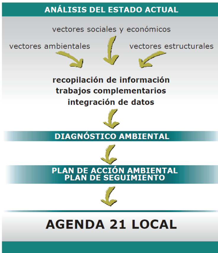
METODOLOGÍA UTILIZADA PARA LA ELABORACIÓN DE LA AGENDA 21 LOCAL

Las agendas 21 se elaboran de forma local, así el siguiente cuadro muestra la metodología a seguir en su elaboración: