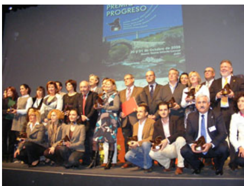
Imagen de los premiados en la IV Edición del Premio Progreso

En esta Edición han participado un total de 118 proyectos, presentados a las modalidades de cultura, deportes, empleo, igualdad, juventud, medio ambiente, nuevas tecnologías en la administración local, servicios sociales, turismo, vivienda y urbanismo, y proyectos internacionales.